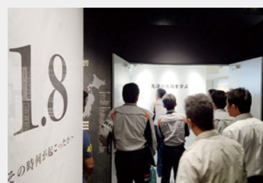
安全教育施設「伝心館」での研修