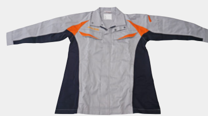
経験者にヒアリングし、安全性・機能性・快適性にこだわって開発したマタニティワーキングウェア