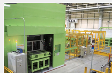
電動車の増加に伴う旺盛な需要にこたえるため2022年10月に竣工した電子部品の第3ライン