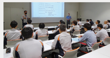
社内で実施した品質マネジメントシステムISO9001の内部監査員向け教育の様子